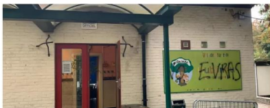
Brandstichting in vier scholen in Charleroi en alles lijkt te draaien rond "Evrás", het nieuwe decreet over seksuele opvoeding

Hoe voel jij je bij het nieuws over de protesten in Wallonië tegen 'Evrás', het nieuwe decreet over seksuele opvoeding?